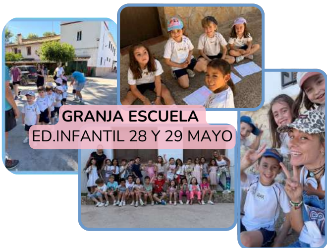
GRANJA ESCUELA ED.INFANTIL 28 Y 29 MAYO