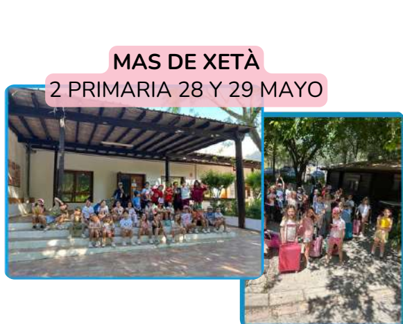
MAS DE XETÀ 2 PRIMARIA 28 Y 29 MAYO