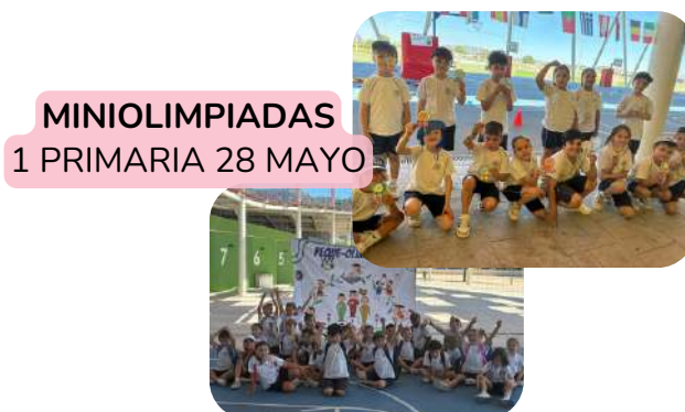
MINIOLIMPIADAS 1 PRIMARIA 28 MAYO