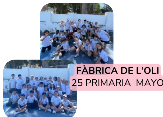
FÀBRICA DE L'OLI 25 PRIMARIA MAYO